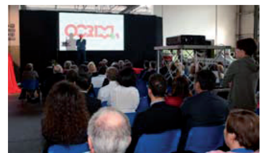
Un momento dell'open day del 23 settembre