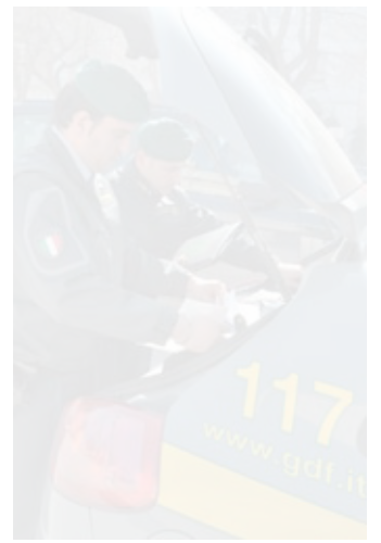
La Finanza ha condotto l'inchiesta