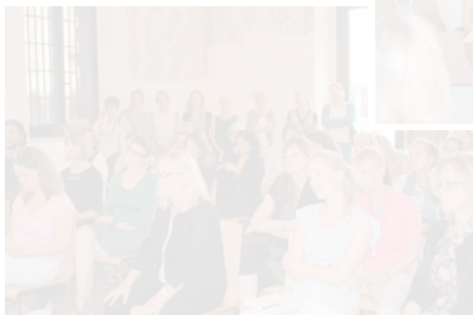
La delegazione danese che ha assistito all'incontro in SpazioComune